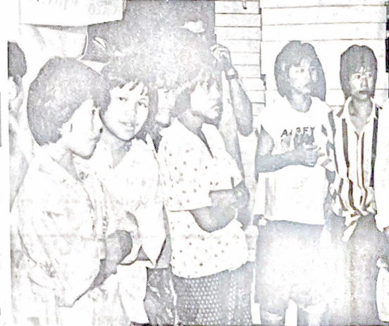
ตำรวจได้เข้าช่วยเหลือบรรดาเด็กเหล่านี้จากโรงงานแห่งหนึ่ง ซึ่งใช้แรงงานเด็กอย่างผิดกฎหมาย

พรพจน์ ฉิน นคร ขงใหม่ ภาคกลาง ที่กาญจนบุรี ภาคอีสาน ภาคใต้ ที่สงขลา และมารวมรวม พรบ.คุ้มครองแรงงานเด็ก พ.ศ. 2503 ซึ่งระบุว่าเด็กที่มีอายุต่ำกว่า 3 เดือน ซึ่งต่ำกว่า แก้วให้หมักสูงสูงขึ้นและเพิ่มเติมนับหมักไทยผู้จัดหาหรือซักรับเด็กมาค้าประเวณี “ปัญหาใหญ่ คือ การใช้แรงงานเด็กในภาคเกษตรกรรม โดยเฉพาะในไร่ อ้อยเป็นปัญหาเด่น เกิดขึ้นเพราะกฎหมาย