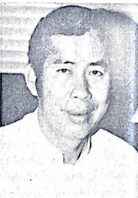
ศ.ดร.ธรรมบุญ โสภารัตน์ อธิการบดี รามฯ

ภาคไทย แต่อาจจะมาจากไหนก็ตามตัวเอง เพราะ “เป็นโยบายที่ปิดกั้น เพื่อเอาอกเอาใจพวกท้องถิ่นมากกว่า เป็นความคิดที่คับแคบอย่างชนิดที่